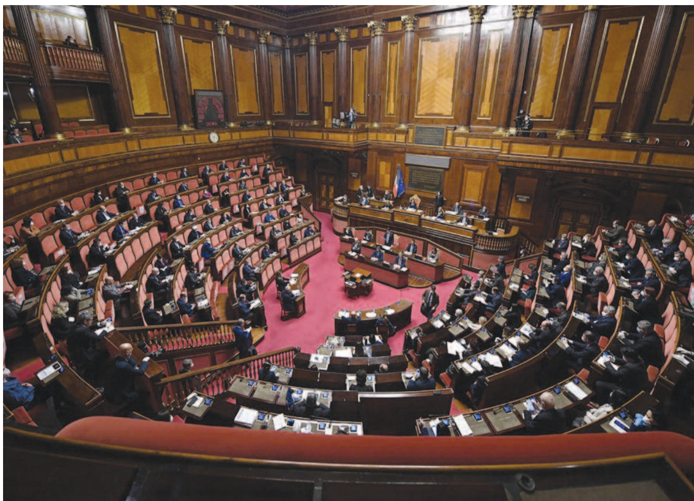
L'Aula di Palazzo Madama

d'interesse internazionali stanno mostrando incrementi (anche se per ora leggeri). Da un altro, prima o poi, verranno re-introdotte regole per la stabilità nell'unione monetaria e per gli aiuti di Stato nell'Ue: non saranno necessariamente identiche alle precedenti, ma in un'area valutaria non ottimale (come l'Unione monetaria europea) sono necessarie per il funzionamento della moneta unica. Queste due determinanti potrebbero fare esplodere la situazione italiana e portare a una crisi peggiore di quella del 2011-2012 che potrebbe comportare anche un'uscita dalla moneta unica con una perdita del reddito e del patrimonio di circa il 30% per tutti gli italiani.