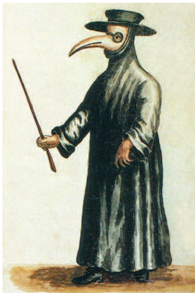
Il medico della peste

mie? A, questo proposito, è opportuno ricordare che, nel 1867, il chirurgo scozzese Joseph Lister intuì che l'acido fenico, utilizzato per eliminare gli odori del liquame, risultava efficace per disinfettare non solo le ferite post-operatorie (salvo a provocare modeste bruciature della pelle), ma anche il campo operatorio, ivi compresi gli strumenti di lavoro, tramite un dispositivo che nebulizzava il disinfettante. In tal modo, si evitava lo sviluppo di quei germi che Pasteur aveva appena scoperto l'esistenza, e che, alcuni anni dopo, il batteriologo Carl Flugge dimostrò essere responsabili nel veicolare, per via aerea, alcune malattie, attraverso l'emissione da parte del soggetto malato, di goccioline di saliva o muchi dal naso. Nel 1897, il chirurgo austriaco Mikuliz Radecki, sulla scorta di queste espe-